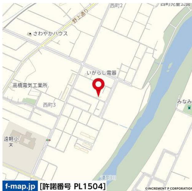
f-map.jp [許諾番号 PL1504]